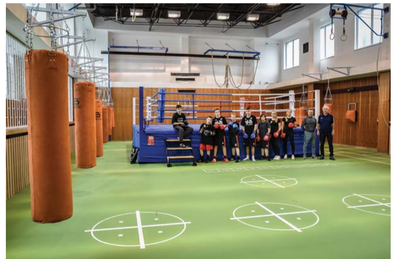
Novou tělocvičnu má i ZŠ Nádražní.