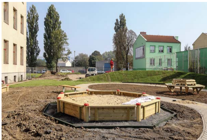
Zahrada ZŠ a MŠ Waldorfská ještě před dokončením.