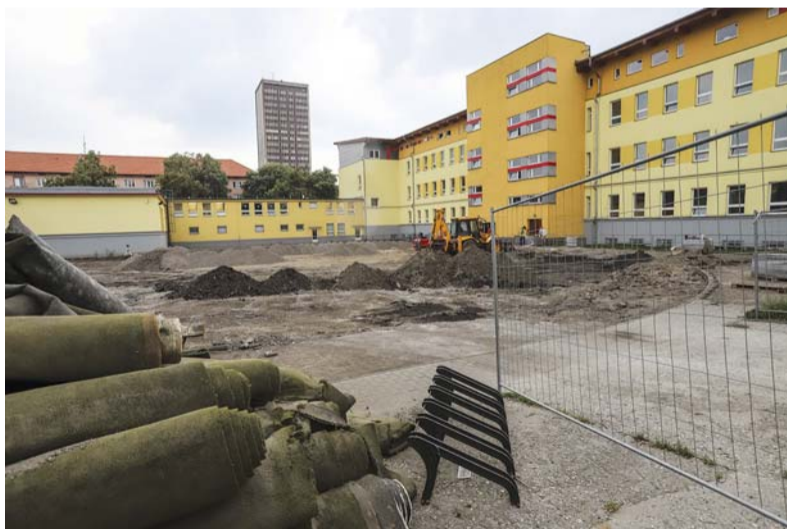
Tak začínala rekonstrukce hřiště u ZŠ a MŠ Ostrčilova.