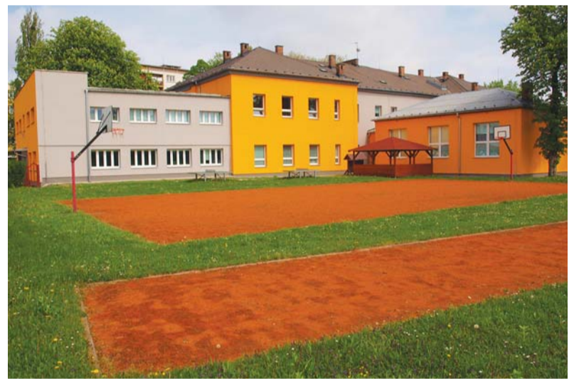
O prázdninách otevírají některé školy hřiště veřejnosti.