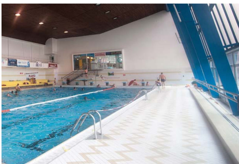
Městský obvod přispívá každoročně na plavání žáků ZŠ.