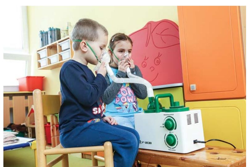
Děti ve většině mateřských škol v obvodu mohou inhalovat.